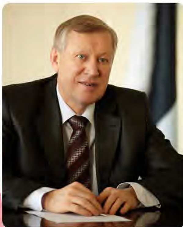
Тэфтелев Евгений Николаевич, Глава города Магнитогорска Evgeny Teftelev, Mayor of Magnitogorsk

Магнитогорск подал заявку на вступление в Евразийского отделение ОГМВ.