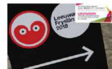
Leeuwarden Frysian ECOC 2018