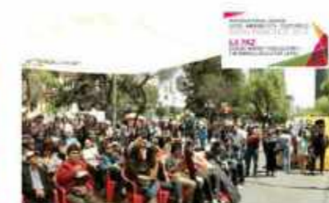
La Paz Market for cultures