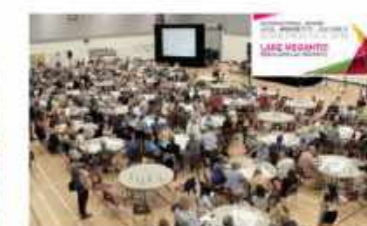
Lake Megantic Rebuilding Lake Megantic