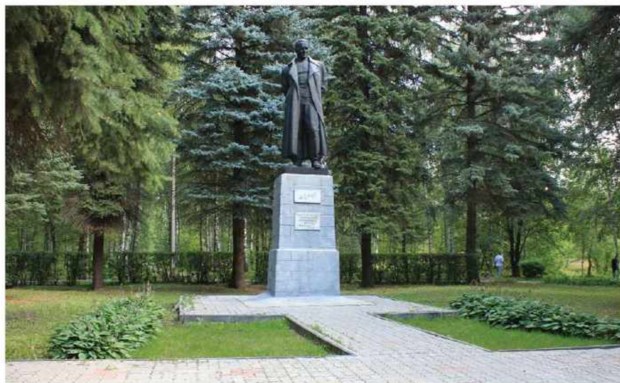
Парк «Гайдар». г. Арзамас.

Thus, in the category “The Historical Settlements” the winner is the project to develop V. Lenin Square in the city of Yelabuga. The project “Historical Part of the City – Magals” in Derbent has also