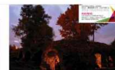
Kaunas Sančiai, cabbage field