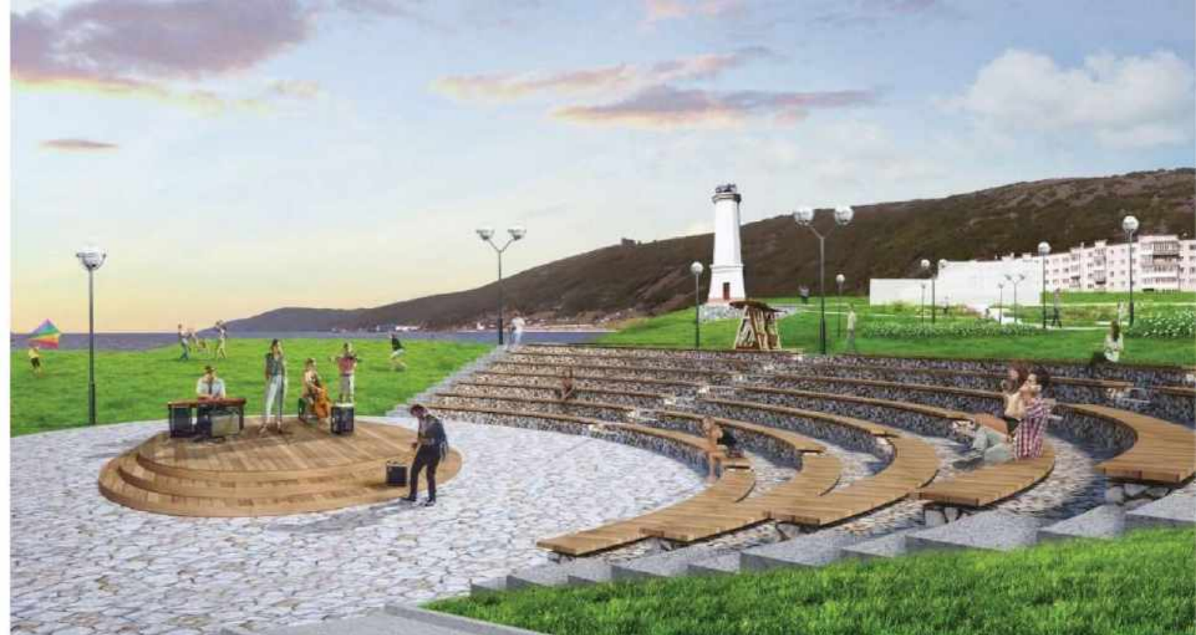
Парк «Маяк». г. Магадан.