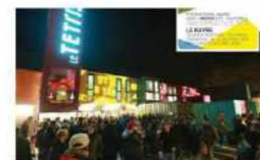
Le Havre Build together