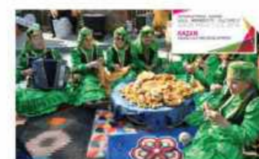
Kazan Cultural development