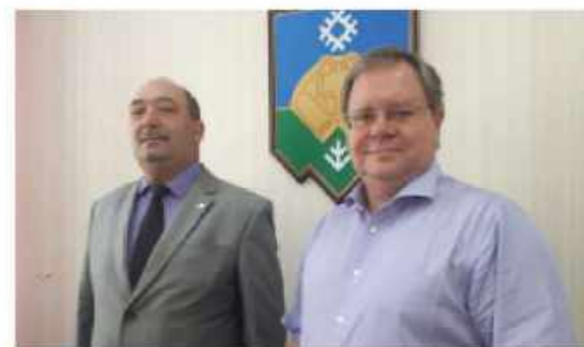
Встреча с главой Сыктывкара В.В.Козловым Meeting with Valery Kozlov, the mayor of Syktvykar

Сыктывкар – столица Республики Коми. Население составляет более 280 тысяч человек.