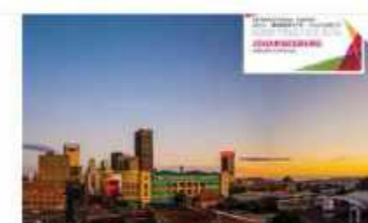
Johannesburg Joburg Carnival

Cultural projects, programs and policies implemented by cities and local governments from across the world, including the project of cultural development of Kazan, are described on the web-site.