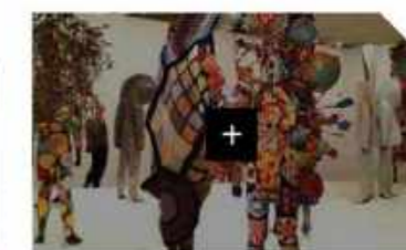
Lille Metropole Cultural policies

ОГМВ приглашает глав местных и региональных правительств направить успешные городские проекты в области культуры и устойчивого развития по электронной почте info@agenda21culture.net . Участие в инициативе безусловно будет способствовать повышению имиджа городов-участников и обогащению передовым опытом пользователями сайта.