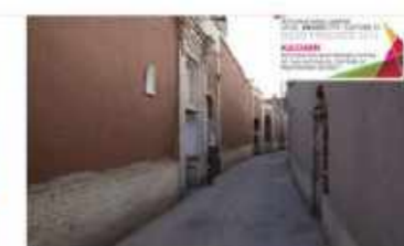
Kashan Mohtasham district